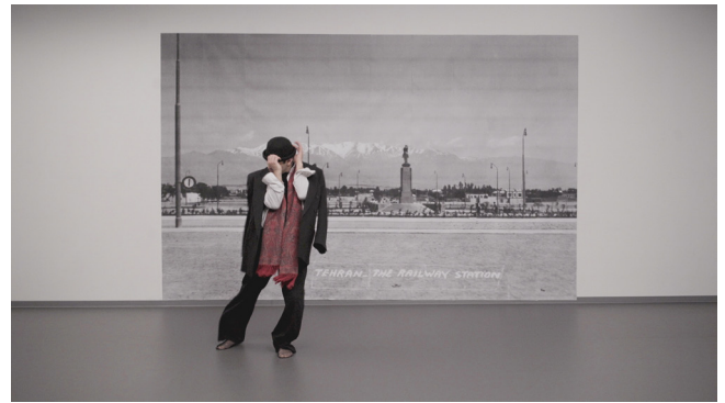
Hannah Darabi, Ausschnitt aus dem Video „Sina“, aus der Serie „Follow the Beat“ [Folge dem Rhythmus], Why Don't You Dance? [Warum tanzst du nicht?], 2026