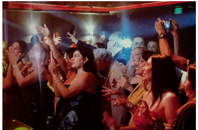
Hannah Darabi, aus der Serie „Cabaret Tehran, House of Legends“ [Cabaret Tehran, Haus der Legenden], Why Don't You Dance? [Warum tanzst du nicht?], 2026