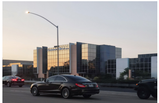
Hannah Darabi, aus der Serie „Tehran-Los Angeles, Return Journey“ [Téhéran-Los Angeles, Hin und zurück], Why Don't You Dance? [Warum tanzt du nicht?], 2026