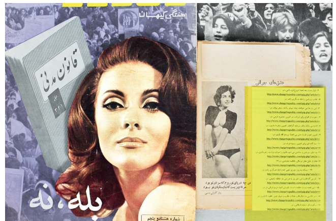
Constitutional Law, Polygamy, Yes / No: In this stage, one man lives with one woman, but the relationship is such that polygamy and occasional infidelity remains the right of the men, even though for economic reasons polygamy is rare, while from the women the strictest fidelity is generally demanded throughout the time she lives with the man, and adultery on her part is cruelly punished.