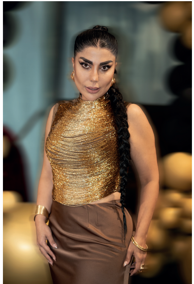
Hannah Darabi, de la série Cabaret Tehran, House of Legends [Cabaret Tehran, Maison des Légendes], Why Don't You Dance? [Pourquoi ne dances-tu pas ?], 2026 © Hannah Darabi