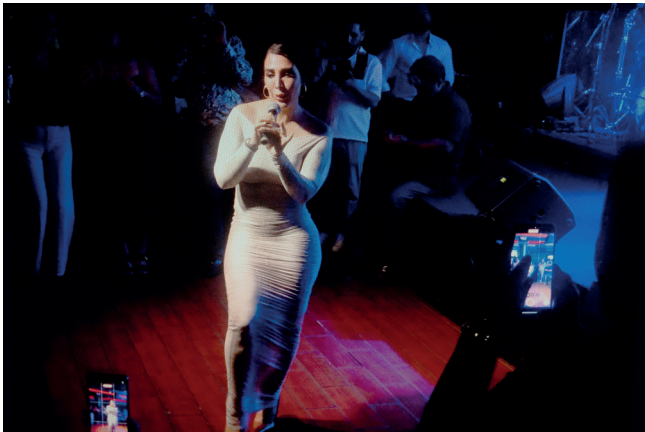
Hannah Darabi, de la série Cabaret Tehran, House of Legends [Cabaret Tehran, Maison des Légendes], Why Don't You Dance? [Pourquoi ne dances-tu pas ?], 2026