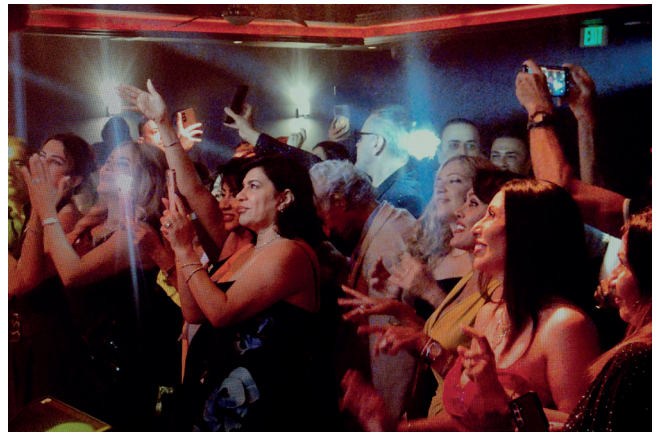
Hannah Darabi, de la série Cabaret Tehran, House of Legends [Cabaret Tehran, Maison des légendes] Why Don't You Dance? [Pourquoi ne danses-tu pas?], 2026