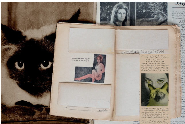
I saw her in the Strasse, and in the Rue as well, pursued her in the High-Street, she had me in her spell. "Women and Cats"