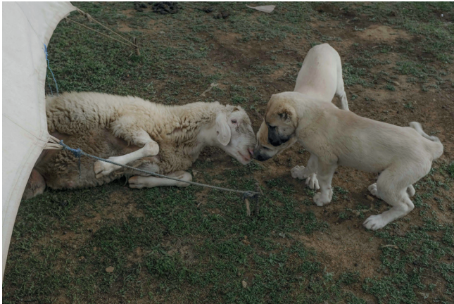
De l'exposition Inferno & Paradiso