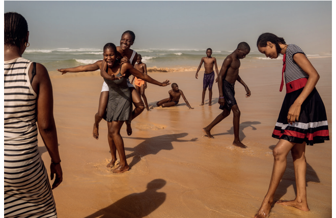
De l'exposition Inferno & Paradiso