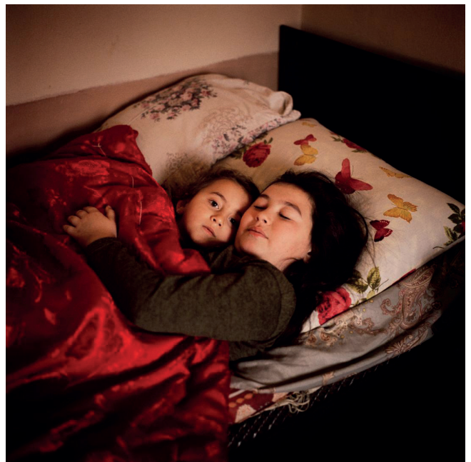
De l'exposition Inferno & Paradiso