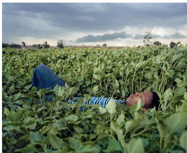
De l'exposition Inferno & Paradiso