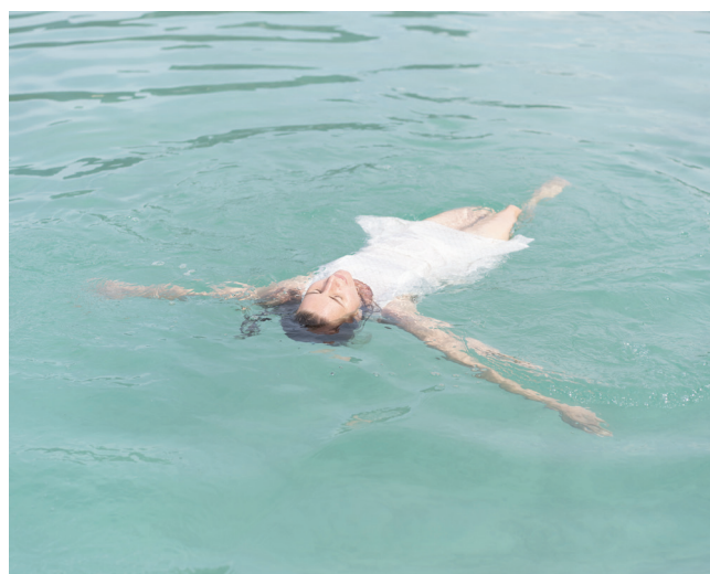
De l'exposition Inferno & Paradiso