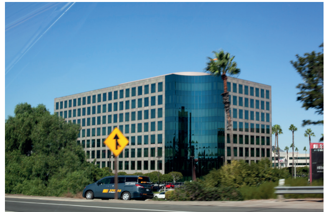
Hannah Darabi, aus der Serie „Tehran-Los Angeles, Return Journey“ [Tehran-Los Angeles, Hin und zurück], Why Don't You Dance? [Warum tanzst du nicht?], 2026