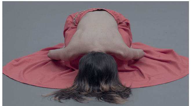
Hannah Darabi, Ausschnitt aus dem Video „Saeed“, aus der Serie „Follow the Beat“ [Folge dem Rhythmus], Why Don't You Dance? [Warum tanzst du nicht?], 2026 © Hannah Darabi

Der alle zwei Jahre verliehene und mit 80.000 Schweizer Franken dotierte Prix Elysée zeichnet Fotokünstler:innen in der Mitte ihrer Karriere für die Umsetzung eines bisher unveröffentlichten Projekts aus. Er steht ganz im Zeichen des Anspruchs von Photo Elysée, zeitgenössisches künstlerisches Schaffen zu fördern und Künstler:innen in einer entscheidenden Phase ihrer Laufbahn begleitend zu unterstützen.