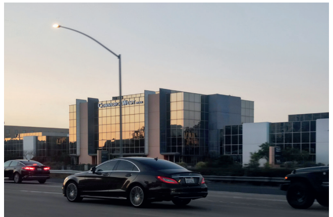
Hannah Darabi, aus der Serie „Tehran-Los Angeles, Return Journey“ [Téhéran-Los Angeles, Hin und zurück], Why Don't You Dance? [Warum tanzt du nicht?], 2026