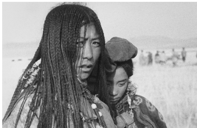
Ella Maillart, Bergères tangoutes au 108 tresses , 1935, Qinghai, République de Chine