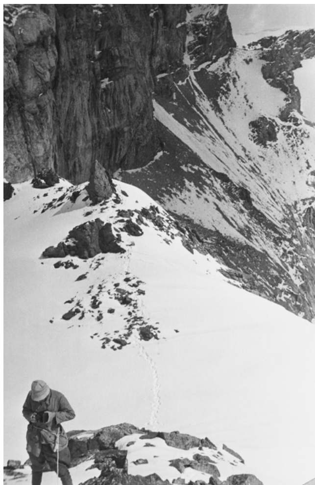
Ella Maillart, Au col d'Ak-Ogouz, 1932, République soviétique socialiste autonome kirghize, URSS