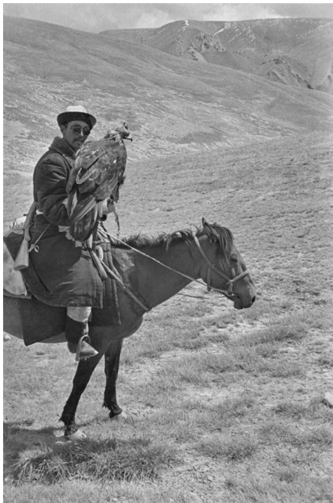
Ella Maillart, Un Karakirghize avec des lunettes chinoises , 1932, République soviétique socialiste autonome kirghize, URSS