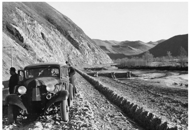
Ella Maillart, La route japonaise en construction , 1934, Mandchoukouo