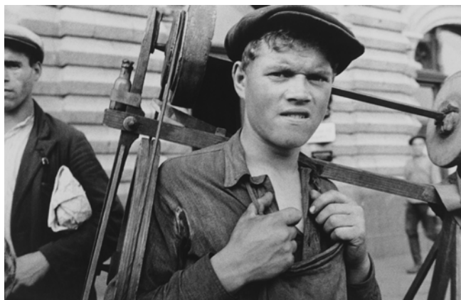
Ella Maillart, Rémouleur ukrainien , 1930, Moscou, République socialiste fédérative soviétique de Russie, URSS © Succession Ella Maillart et Photo Elysée, Lausanne