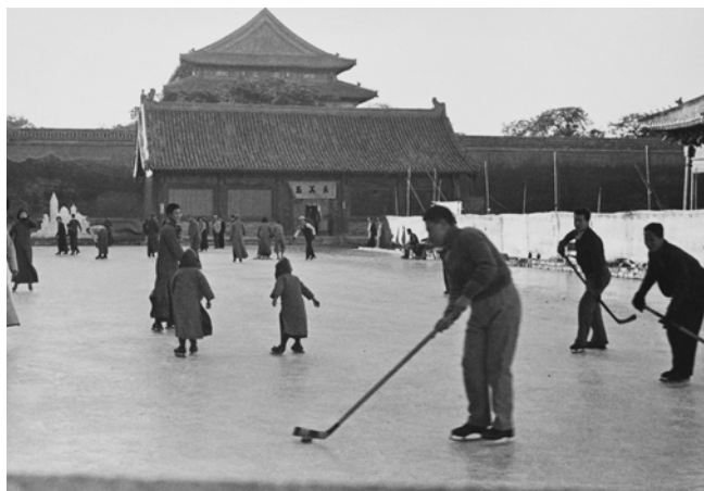
Ella Maillart, Patineurs devant la Cité interdite , 1935, Pékin, République de Chine