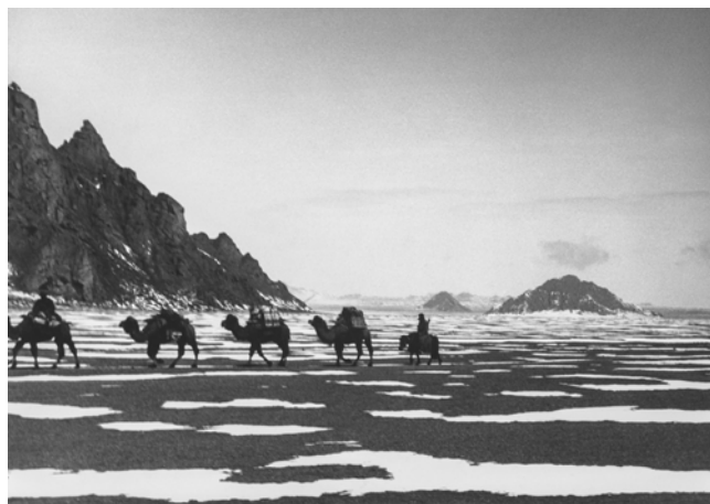
Ella Maillart, Désert du Tsaidam, 3'000 m alt. Fin mai, mont Kitin Kara, dans la chaîne des Kuen Lun, 1935, Qinghai, République de Chine