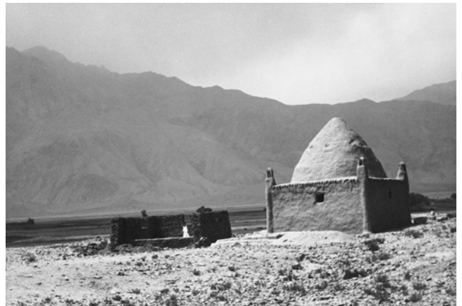
Ella Maillart, Tombeaux : à droite, classique style musulman. À gauche, peut-être une survivance des adorateurs du Fen chez les Tadjiks actuels , 1935, Tashkurgan, République de Chine © Succession Ella Maillart et Photo Elysée, Lausanne