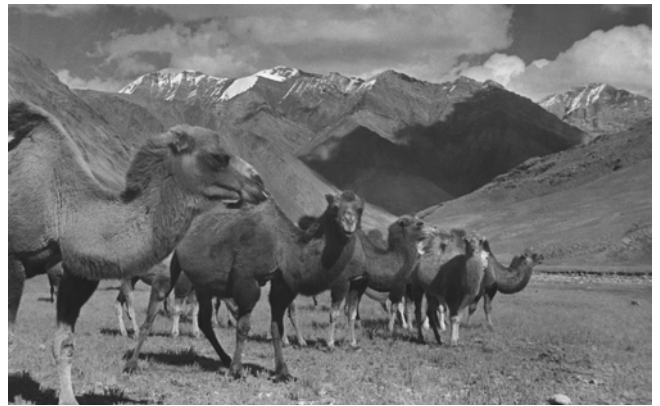
Ella Maillart, Pâturage pour chameaux , 1932, République soviétique socialiste autonome kirghize, URSS

Les archives d'Ella Maillart, qui regroupent ses photographies, ses films et ses écrits, sont conservées par Photo Elysée et par la Bibliothèque de Genève. En avril 2025, ces deux institutions, en collaboration avec la Bibliothèque nationale suisse – détentrice des archives de l'écrivaine Annemarie Schwarzenbach – ont obtenu l'inscription des archives des deux pionnières du récit de voyage au registre Mémoire du monde de l'UNESCO. Cette reconnaissance témoigne de l'importance de leur contribution à un genre littéraire et photographique alors dominé principalement par des hommes.