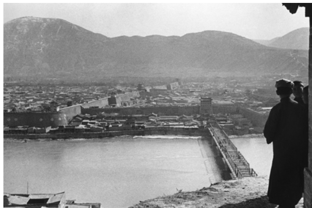
Ella Maillart, La capitale Lanchow sur le Fleuve Jaune, ville de 500'000 habitants , 1935 Lanzhou, République de Chine