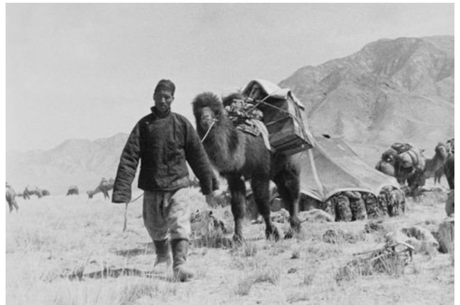
Ella Maillart, Li arrive au campement avec la caisse de cuisine , 1935, Qinghai, République de Chine © Succession Ella Maillart et Photo Elysée, Lausanne