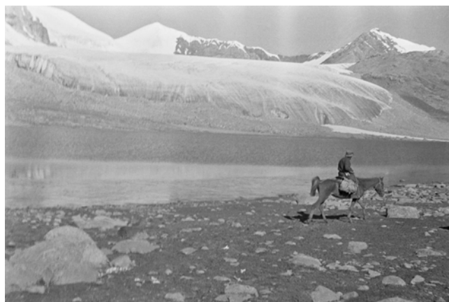
Ella Maillart, La chaîne des Tierskei à 4800 m. ; le col de Kachkassou est pratiqué par les caravanes venant de Chine , 1932, République soviétique socialiste autonome kirghize, URSS