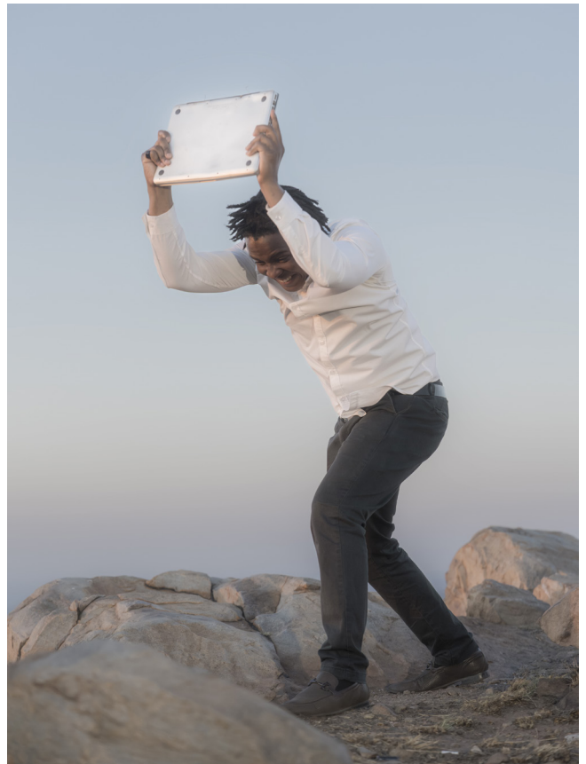
Sans titre, 2025, de la série Death by GPS (2022–en cours) © Salvatore Vitale