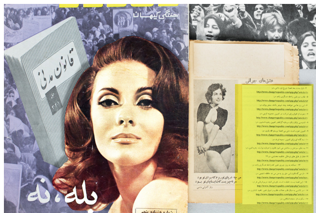
Constitutional Law, Polygamy, Yes / No. In this stage, one man lives with one woman, but the relationship is such that polygamy and occasional infidelity remains the right of the men, even though for economic reasons polygamy is rare, while from the woman the strictest fidelity is generally demanded throughout the time she lives with the man, and adultery on her part is cruelly punished.

Une exploration approfondie de la collection de Photo Elysée, accompagnée de créations contemporaines en contrepoint.