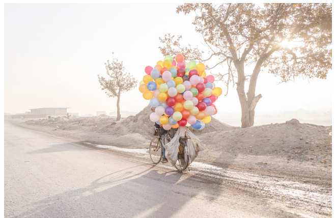
De l'exposition Inferno & Paradiso d'Alfredo Jaar