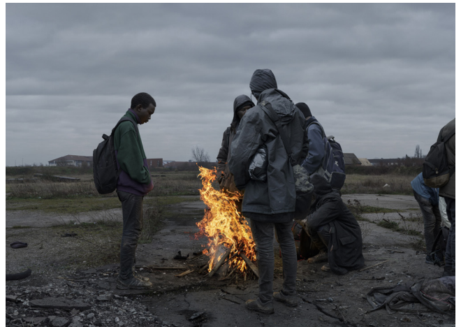
Luc Delahaye, Un feu , 2021

Photo Elysée, qui conserve ses archives photographiques – plusieurs milliers d'images –, souhaite rendre hommage à cette femme hors du commun. À travers les quatre grands voyages qu'elle a réalisés dans les années 1930, l'exposition met en lumière le dialogue entre les images et les textes, et explore le rôle de ce patrimoine photographique dans la constitution et la préservation de la mémoire du monde.