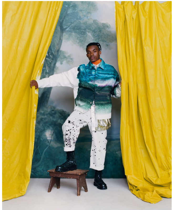
Tyler Mitchell, Curtain Call , 2018, per gentile concessione dell'artista e della Gagosian Gallery © Tyler Mitchell

Da oltre un secolo, i grandi eventi sportivi sono corredati da immagini. Con lo sviluppo della fotografia amatoriale a fine Ottocento, che coincide con le prime Olimpiadi moderne nel 1896, la fotografia e lo sport sono, sotto vari aspetti, evoluti di pari passo. Sport in primo piano alza il velo sulle vaste collezioni fotografiche del Museo Olimpico e di Photo Elysée. Nel percorrere un patrimonio fotografico ampiamente inedito, la mostra,