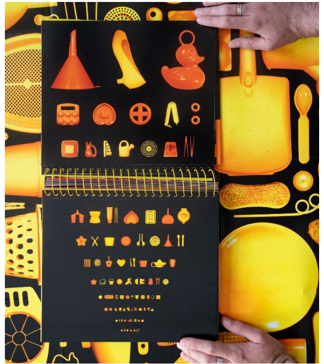
Claire Dé, À toi de jouer I , Éditions les Grandes Personnes, 2010 © Claire Dé.