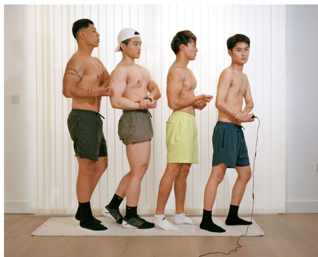
Ziyu Wang, Lads , dalla serie Go Get'Em Boy , Londra, 2022