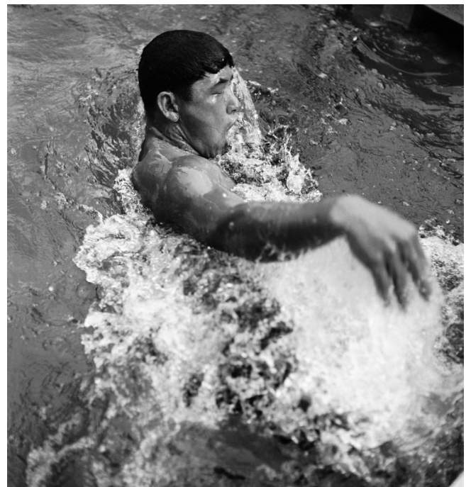
Anonyme, Jeux Olympiques Helsinki 1952, Natation - Un nageur s'entraîne © 1952 Comité International Olympique (CIO)