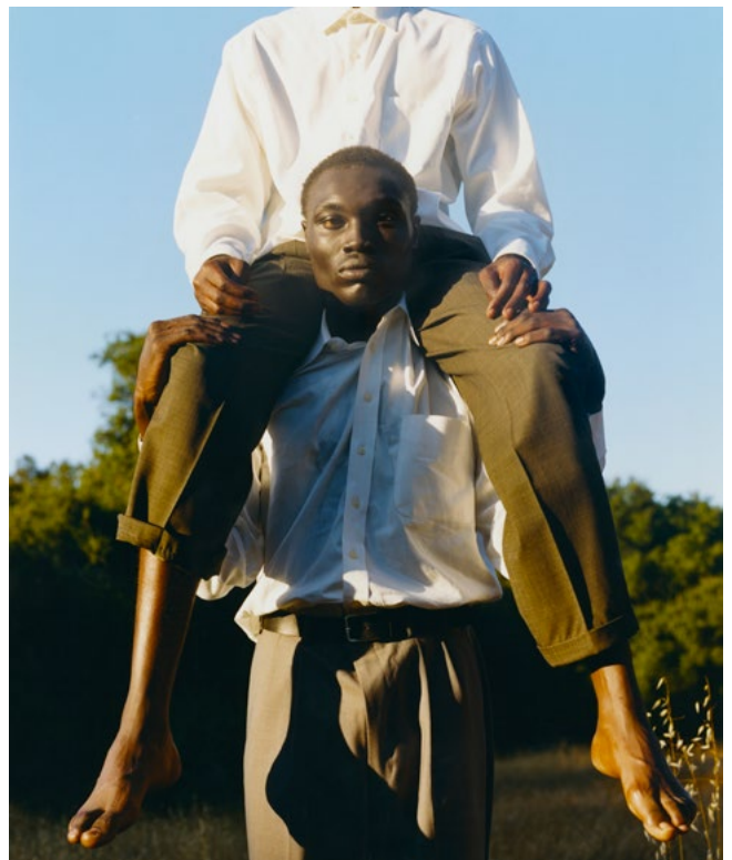
Tyler Mitchell, Sans titre (Topanga II) , 2017, avec l'autorisation de l'artiste et de la Galerie Gagosian © Tyler Mitchell