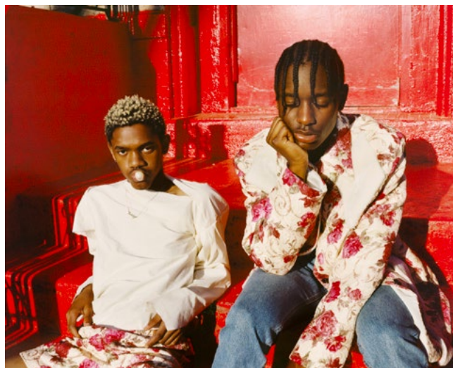
Tyler Mitchell, Sans titre (Red Steps) , avec l'autorisation de l'artiste et de Gagosian Gallery © Tyler Mitchell