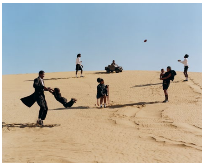
Tyler Mitchell, Albany, Géorgie , 2021