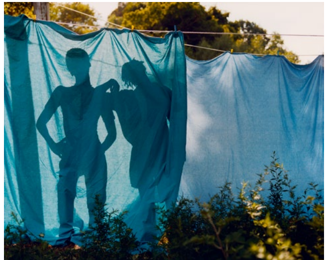
Tyler Mitchell, Sans titre (Blue Laundry Line) , 2019