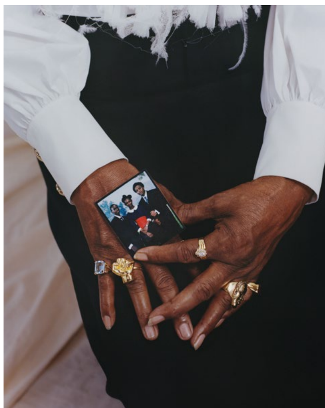
Tyler Mitchell, The root of all that lives , 2020