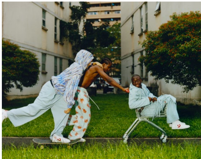
Tyler Mitchell, Motherlan Skating , 2019, avec l'autorisation de l'artiste et de Gagosian Gallery © Tyler Mitchell