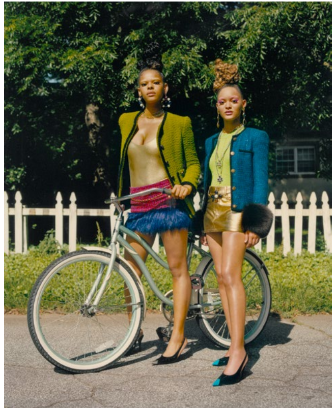
Tyler Mitchell, Sans titre (Sisters on the Block) , 2021, avec l'autorisation de l'artiste et de la Galerie Gagosian © Tyler Mitchell

Le commissariat de l'exposition Tyler Mitchell. Wish This Was Real est assuré par Brendan Embser et Sophia Greiff. Produite par la C/O Berlin Foundation en collaboration avec Tyler Mitchell Studio, cette exposition a bénéficié du soutien de l'Art Mentor Foundation Lucerne.