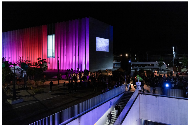
Nuit des images 2024

A l'occasion de la Nuit des images, les trois musées de Plateforme 10 étaient exceptionnellement ouverts jusqu'à 1h du matin, permettant au public présent de découvrir les expositions, dont celles faisant partie de la saison surréaliste. À Photo Elysée, le public a pu découvrir le travail des huit artistes artistes récemment nommé-e-s pour le Prix Elysée 2025. Trois nouvelles expositions ont également été dévoilées, dont l'hommage à Sabine Weiss (1924-2021) ainsi que les expositions des artistes suisses Tamara Janes et Olga Cafiero.